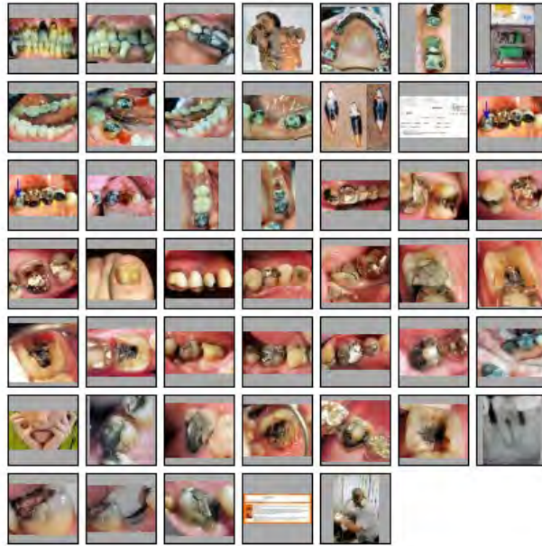
Prof. Dr. Dr. Staehle gewidmet:: Bilder Amalgam II